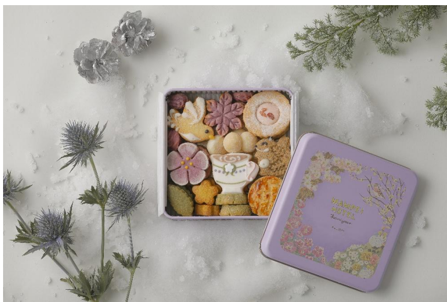
「万平ホテルフラワークッキー缶・冬」イメージ

万平ホテル（所在地：長野県北佐久郡軽井沢町、総支配人：佐々木一郎）は、2025 年 11 月 25（火）から 2026 年 2 月 28 日（土）まで、冬の軽井沢の草花や小動物が彩る当ホテルの「カフェテラス」をイメージした「万平ホテルフラワークッキー缶・冬」を店頭およびオンラインにて販売いたします。