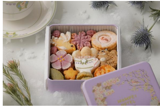
「万平ホテルフラワークッキー缶」イメージ

2025年8月発売の「万平ホテル フラワークッキー缶」の第2弾として、雪景色の「カフェテラス」を表現した冬限定デザインが登場。ロイヤルミルクティーが注がれたすすらんのティーカップや、雪をまとった小動物をかたどったクッキーが並び、冬の軽井沢の情景を閉じ込めました。